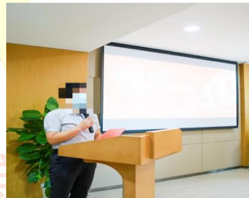
(图例 4: 照片示例)