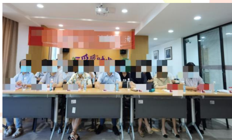
(图 3: 照片示例)

2) 照片要求： 项目合作高校对项目开展的每场活动至少提交反馈 5 张现场照片，图片需包含全景和局部特写。(照片可参照图 3、图 4)