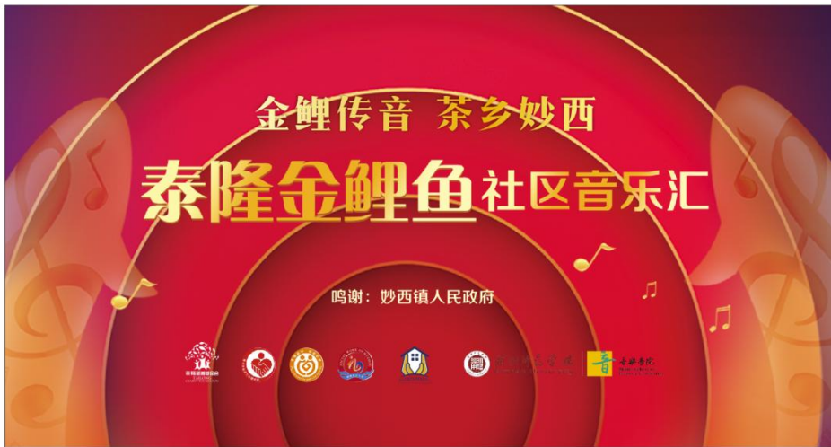
(图 3. 主屏示例)