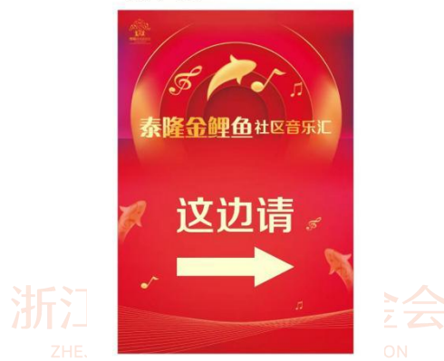
(图 4. 指引牌示例)