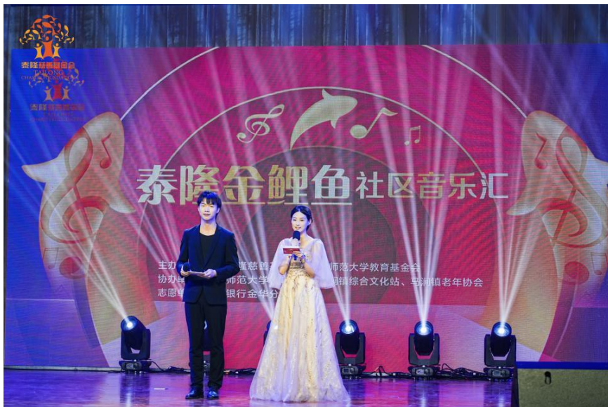
（图 6. 图片示例）

B. 单场活动不少于提交 5 张照片，图片需包含全景、社区居民与节目互动、志愿者服务等场景。（节目主持可参照图 6、合影可参考图 7）。