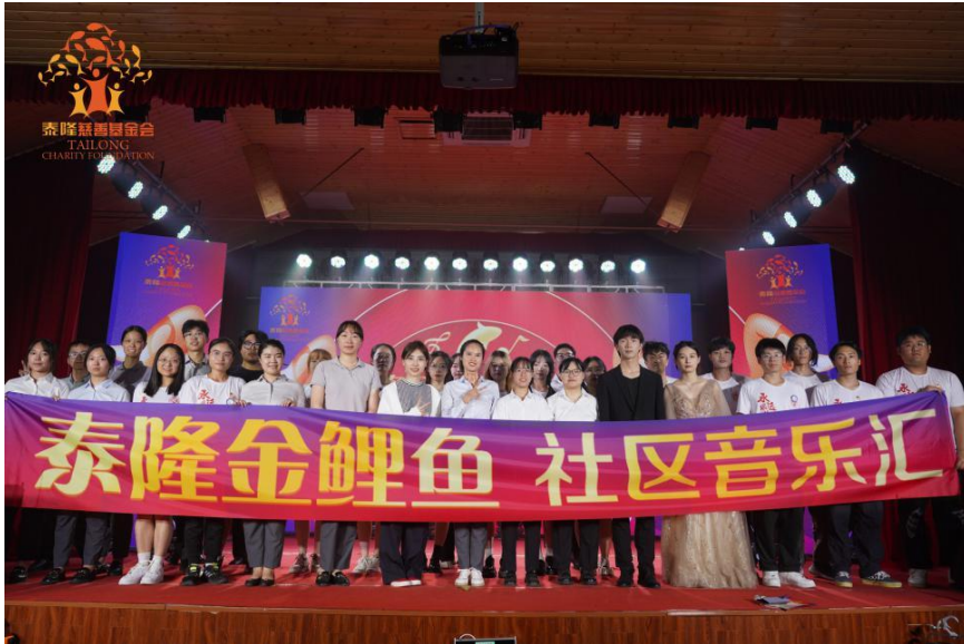
(图 7. 图片示例)

注：如合作机构在项目预算中列支了“图片直播”服务，除了当天提供活动直播照片外，还需要将活动的原始图片以优盘或存档网盘提交给浙江泰隆慈善基金会保存。